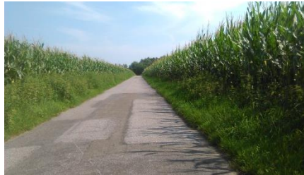
Ist das ein korrekter Maisanbau?

meldorf nichts geschehen. Die Wegerandstreifen, die der Gemeinde gehören, sind wieder beackert und eingesät worden.