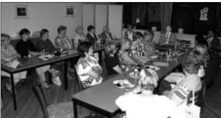
Kath. Frauengemeinschaft Holsten-Bexten