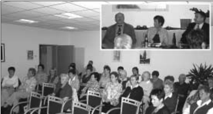
Kath. Frauengemeinschaft Salzbergen