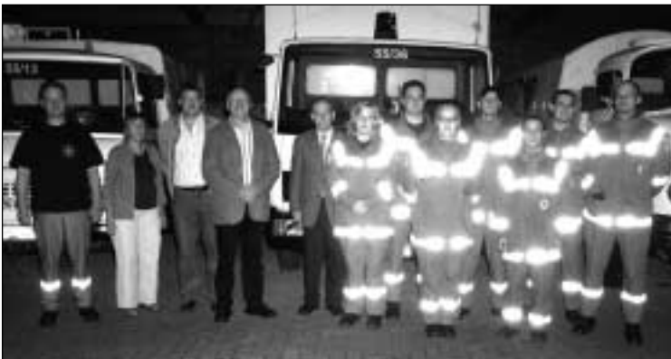
Deutsches Rotes Kreuz Salzbergen